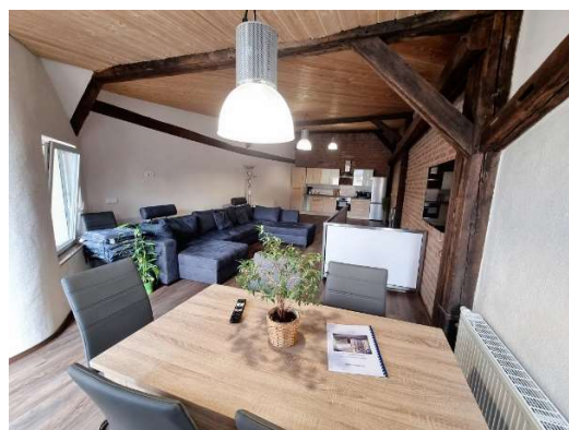
offene Küche mit Wohnzimmer