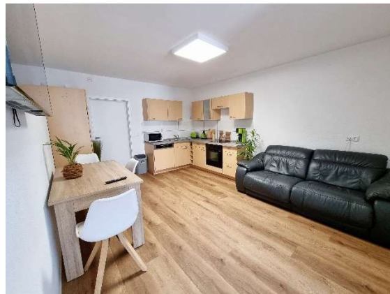
offene Küche mit Wohnzimmer