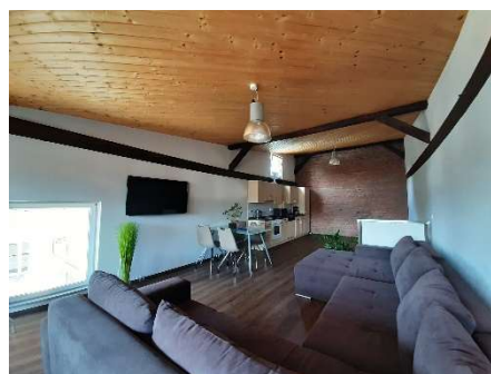
offene Küche mit Wohnzimmer