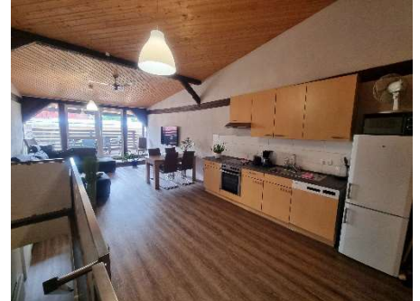
offene Küche mit Wohnzimmer