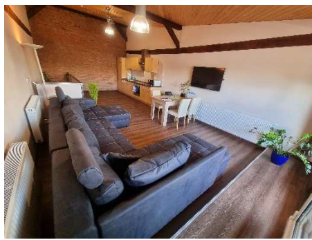
offene Küche mit Wohnzimmer